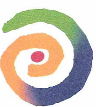
Ev. Familien- Bildungsstätte U e l z e n